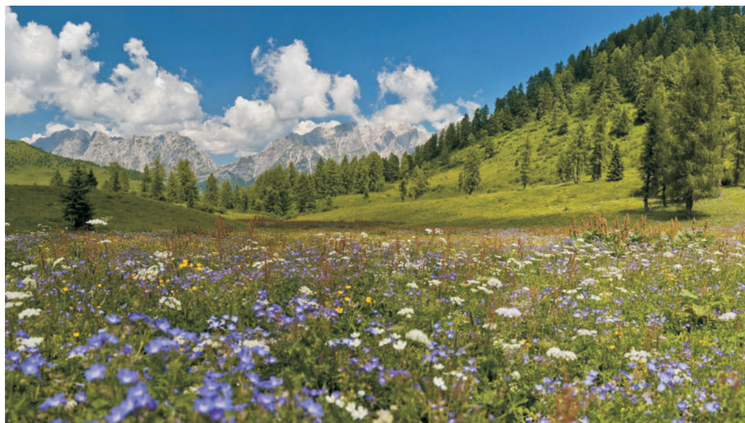
FRIULI VENEZIA GIULIA - CARNIA