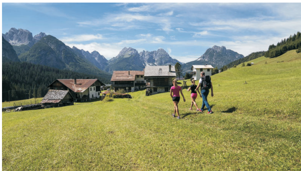
FRIULI VENEZIA GIULIA - CARNIA