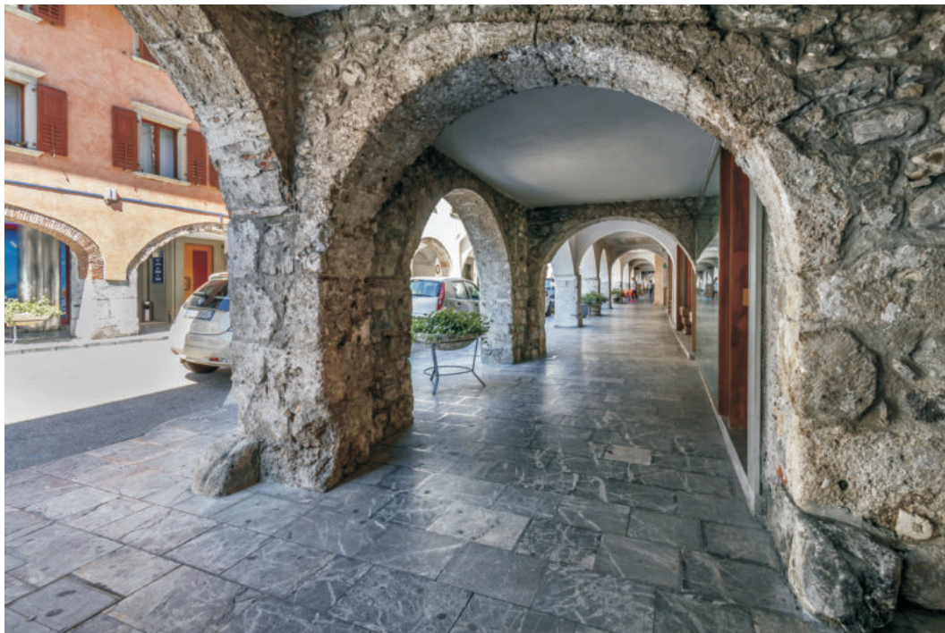
TOLMEZZO - VIA ROMA

ITALY - FRIULI VENEZIA GIULIA - TOLMEZZO