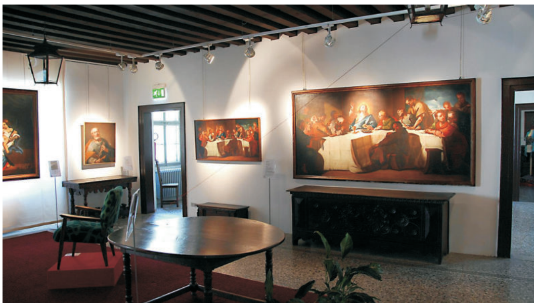
TOLMEZZO - MUSEO CARNICO