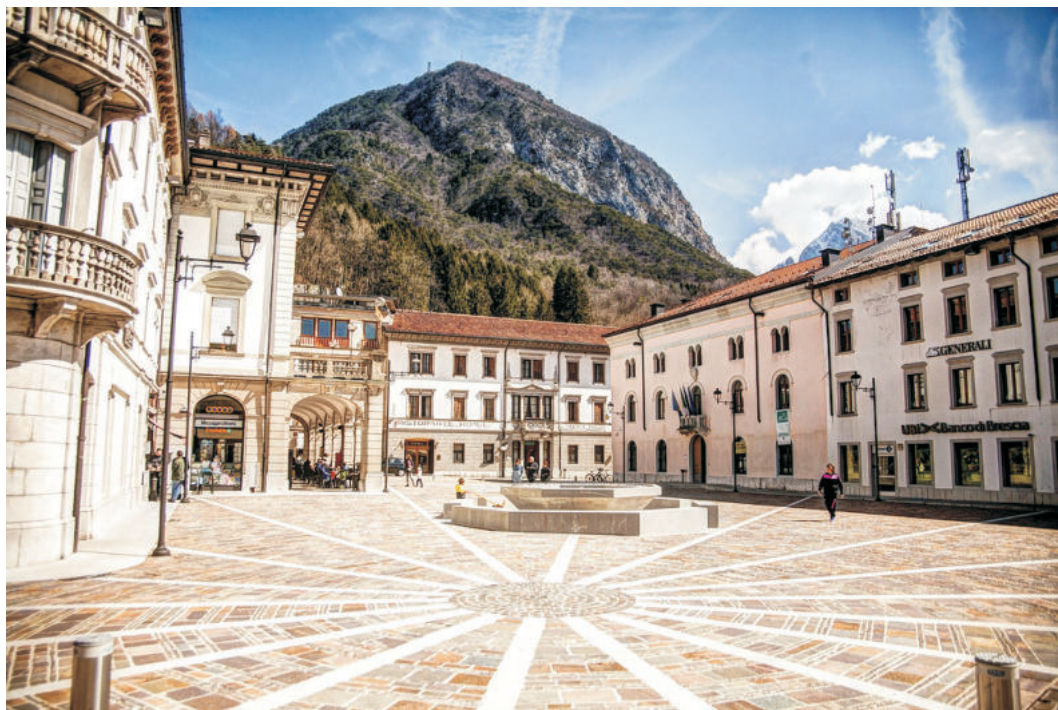
TOLMEZZO - PIAZZA XX SETTEMBRE